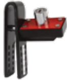
Basic lock / मूल लॉक